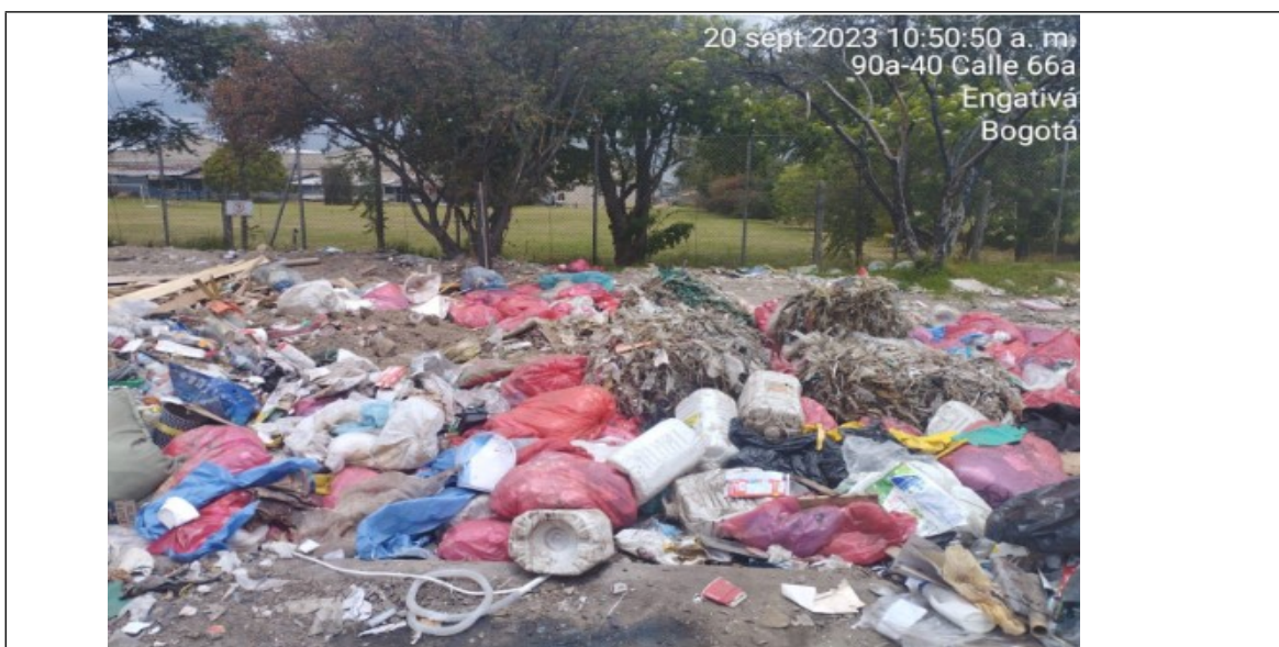
Foto 1 Panorámica del arrojado clandestino de Residuos Hospitalarios tipo infecciosos (biosanitarios, cortopunzantes, anatomopatológicos) residuos químicos (químicos reactivos, recipientes fármacos), en la TV 93 65A 82 IN 1, lote deshabitado y botadero a cielo abierto.

A continuación, se relaciona el registro fotográfico de la atención a la emergencia con evento SIRE 5423032 y con coordenadas geográficas W: 74° 6' 50,09" N: 4° 41' 32,67"