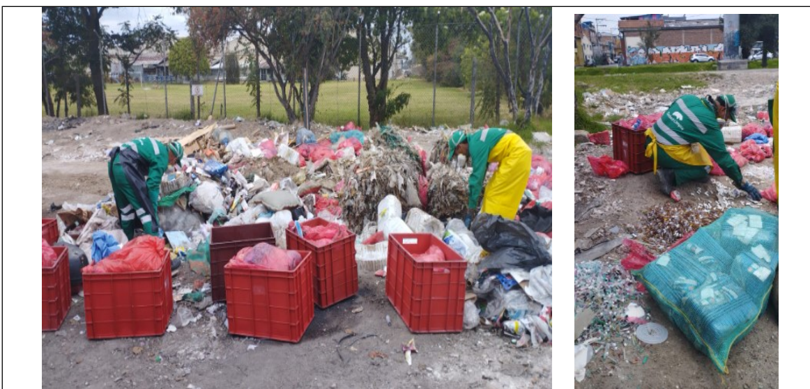
Fotos 3 y 4. Recolección de Residuos Hospitalarios tipo infecciosos (biosanitarios, Cortopunzante, anatomopatológicos) residuos químicos (químicos reactivos, recipientes fármacos) por parte de los operarios del gestor RH S.A.S.

Nota: Con el fin de identificar y clasificar posibles infractores se evidenciaron las bolsas rojas marcadas con los nombres propios de los establecimientos con el contenido de residuos peligrosos.