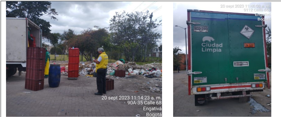
Fotos 5 y 6. Atención y recolección de residuos Hospitalarios y similares (biosanitarios, Cortopunzantes, anatomopatológicos) residuos químicos (químicos reactivos, recipientes fármacos) por parte de los operarios del gestor RH S.A.S y reconocimiento de residuos peligrosos Hospitalarios y Similares por parte del profesional de gestión del riesgo de la alcaldía local de Engativá.